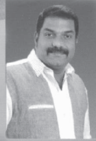
R. Noble Music