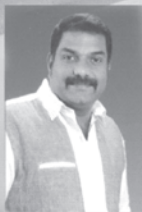
R. Noble Music